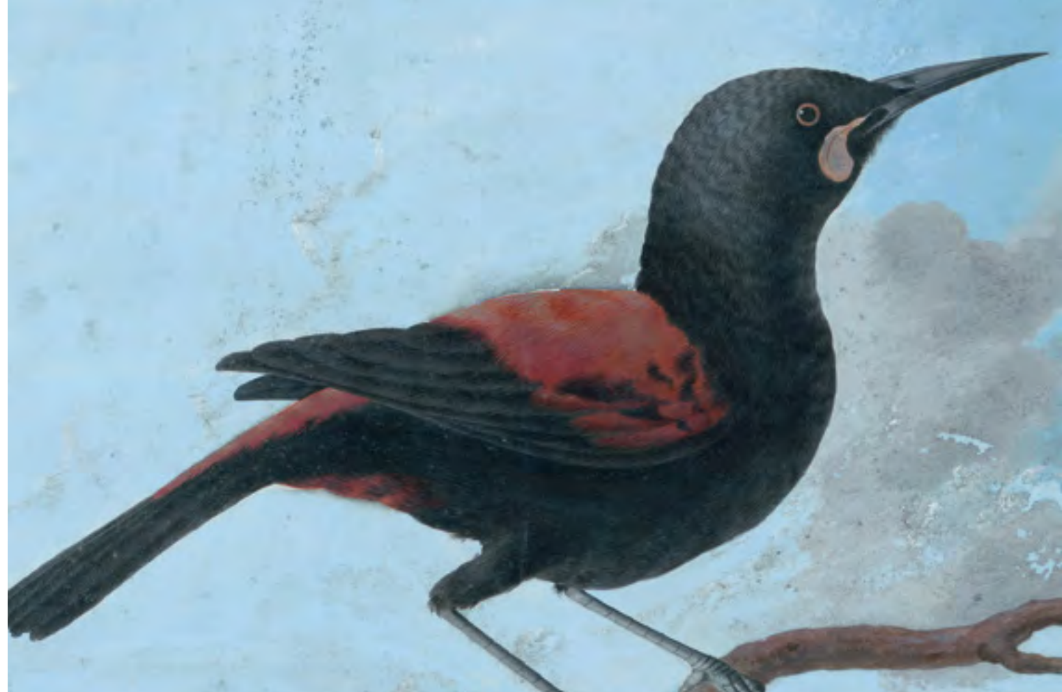
Abb.: Sattelvogel | Lappenstar, 1775/1776, FB Gotha, Cod. Memb. I 131, Bl. 9 © Forschungsbibliothek Gotha der Universität Erfurt, 2018.

Universität Erfurt Forschungsbibliothek Gotha Schloss Friedenstein Schlossplatz 1 99867 Gotha