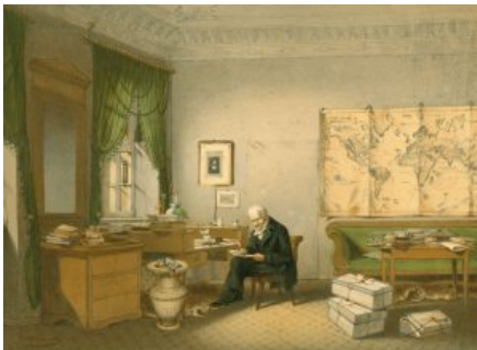
Abb. 1: Alexander von Humboldt in seinem Berliner Arbeitszimmer, Lithographie nach Eduard von Hildebrandt, 1845.

Neben diesen Zeugnissen des wissenschaftlichen Wirkens Humboldts, die ihn mit Gotha verbinden, findet in den Überlieferungen der Sammlung Perthes auch jene, nahezu kultische Verehrung ihren Niederschlag, die den Verfasser des 'Kosmos' in den bürgerlichen Wohnstuben des 19. Jahrhunderts zu einem vielfach gelesenen Autor machte. Gleich mehrfach findet sich auch in der Sammlung Perthes eine jener ikonischen, als Lithographie weitverbreiteten Darstellungen, die den alternden Humboldt in seinem Berliner Quartier inmitten der Utensilien seiner jahrzehntelangen Forschertätigkeit zeigt (vgl. Abb. 1).